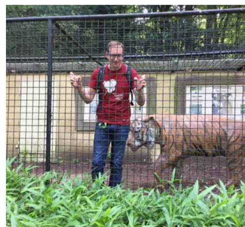
Kirchenhelfer in Gefahr

Das Team der Fahrbereitschaftsschicht vom AdB begrüßt die Teachers Mädels von der Walpurgisschulen.